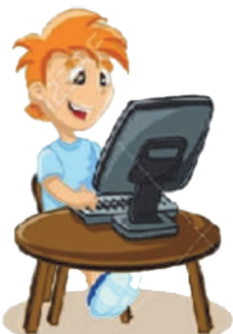
Играть в компьютерные игры: