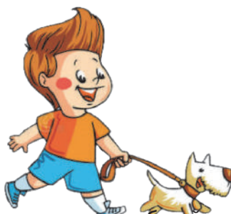
Гулять, играть с собакой: