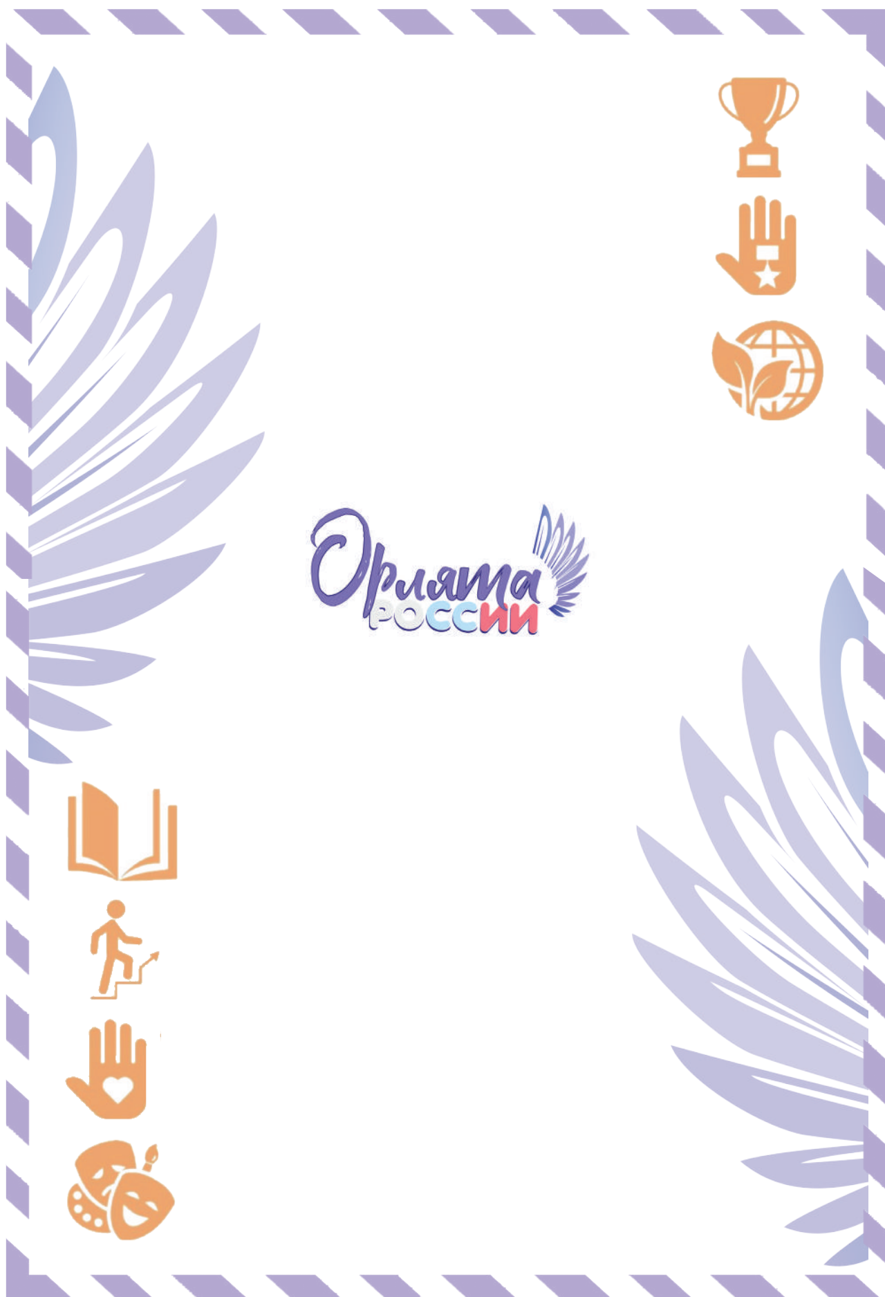
Рис. 2. Обратная сторона «Письма в Будущее»