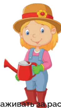
Ухаживать за растениями: