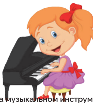
Играть на музыкальном инструменте: