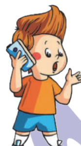
Разговаривать по телефону: