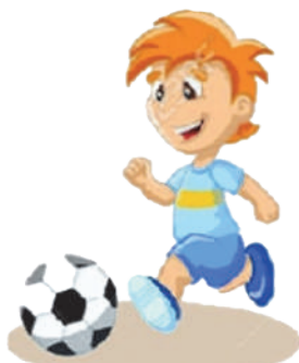
Играть в футбол: