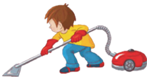
Наводить порядок дома: